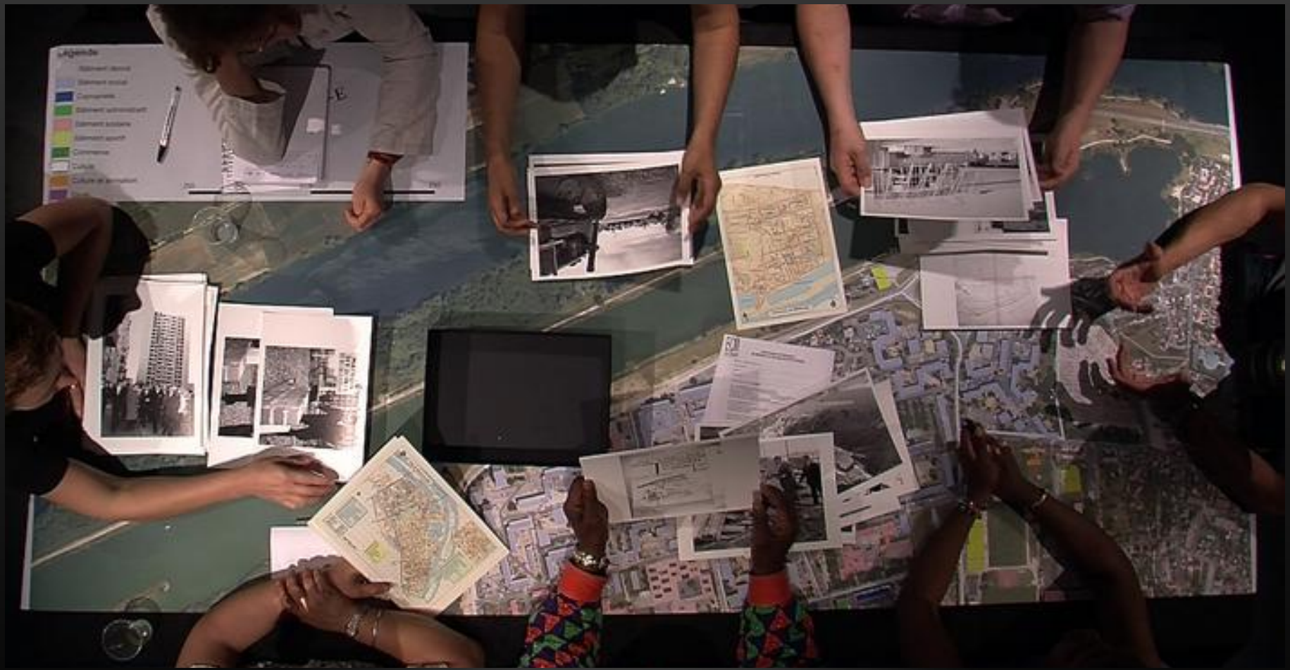
Le PROJET VF – mounir fatmi – 2011/12 – vidéo 00:26:21.