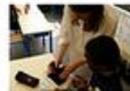
séance de semis