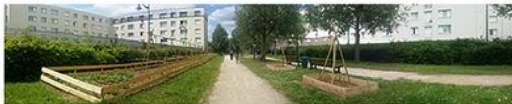
site de l'artiste